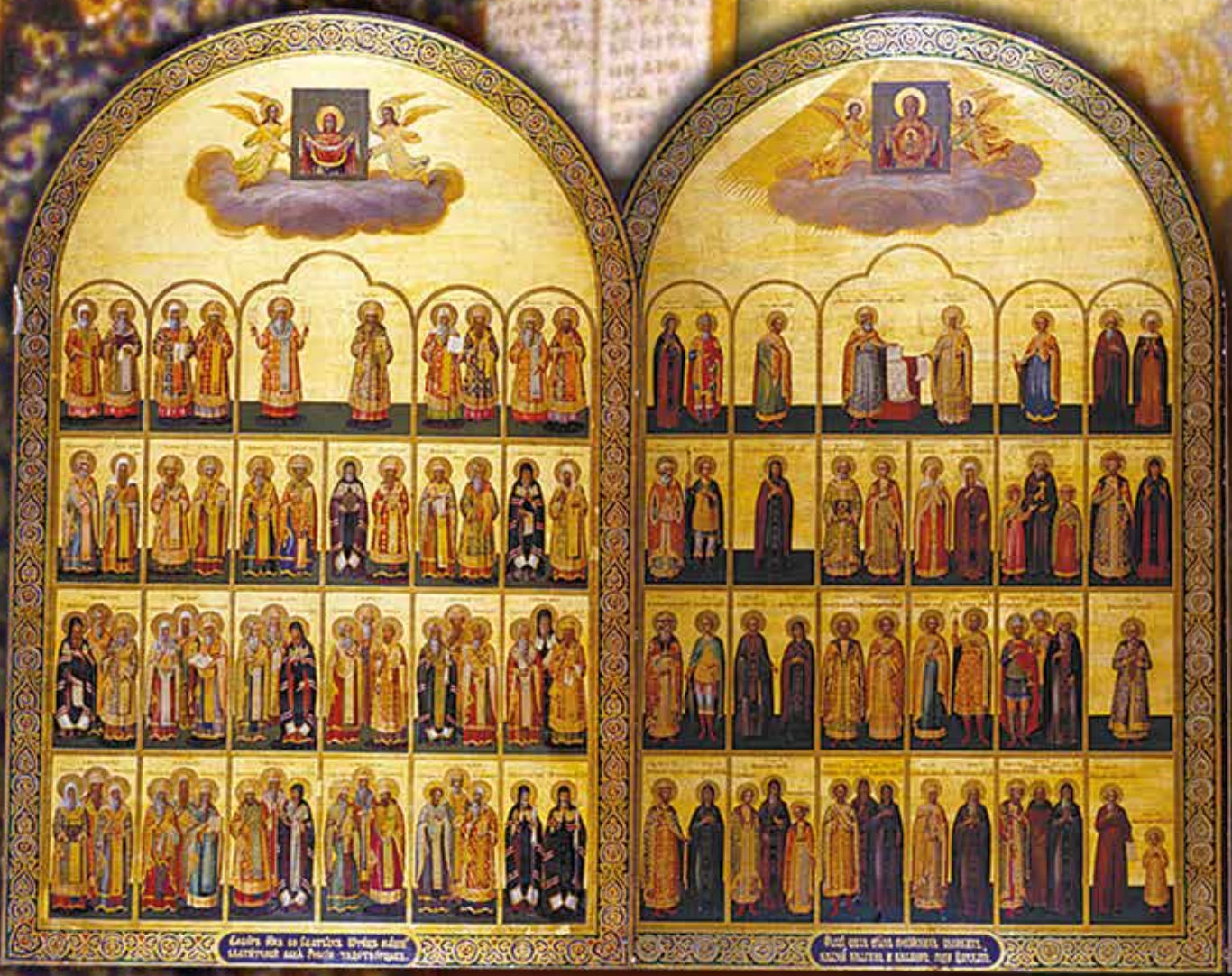
Свѣтъ, яже во свѣтѣхъ свѣтъ естъ, иже въ свѣтѣхъ иже въ свѣтѣхъ.